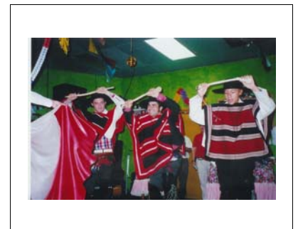
Voces y Danzas de Chile

El grupo folklórico se va a presentar el sábado 10 de Junio del presente año en una de las actividades organizadas por la ciudad de Dallas, en el centro de la ciudad, en el City Art District relacionada con el "City Arts Celebration." Avisaremos con la debida anticipación, la hora y lugar preciso de nuestra presentación.